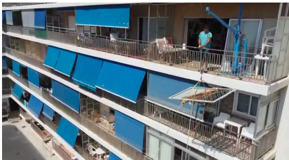
Balcony anchor system Anclaje techo balcón