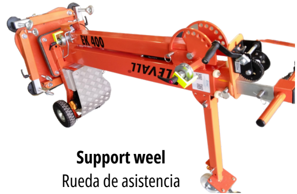
Support wheel Rueda de asistencia