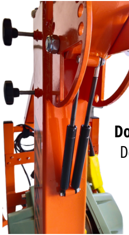
Double Brake & hidrahulic piston Doble freno & pistón hidráulico